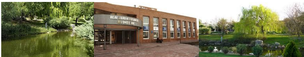
Jardín Botánico Alfonso XIII-UCM

Para cualquier duda o consulta dirigirse a: wta.bienalmadrid2019@gmail.com