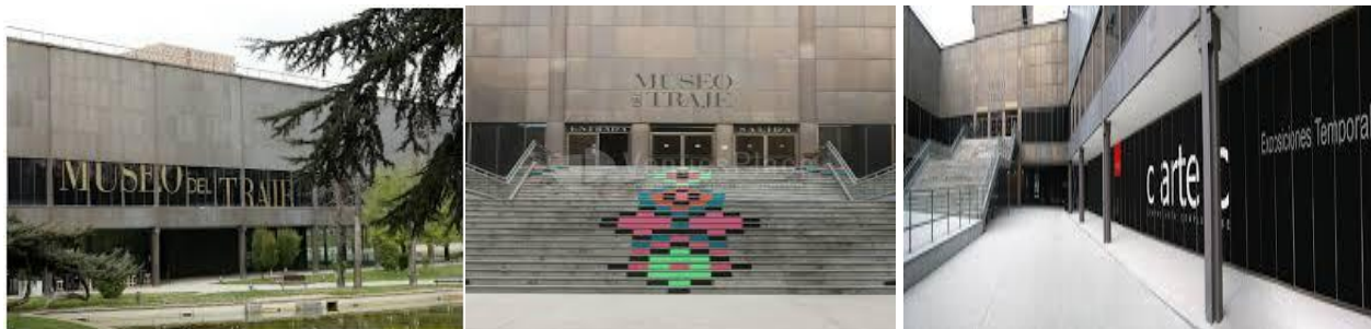
Museo del Traje, Sala c arte c

VIII Bienal Internacional de Arte Textil Contemporáneo Madrid, España 2019