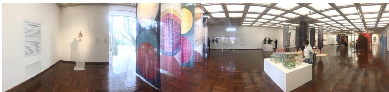
Panorámica de la Exhibición 22 Artistas Invitados. VII Bienal Internacional WTA - Uruguay 2017 Museo Nacional de Artes Visuales (mnav) - Montevideo

Para el año 2019 la Organización se trasladará a Europa, y Madrid (España) será la sede de la VIII Bienal Internacional de Arte Textil Contemporáneo WTA, que se llevará a cabo del 17 de septiembre al 3 noviembre, en diferentes espacios.